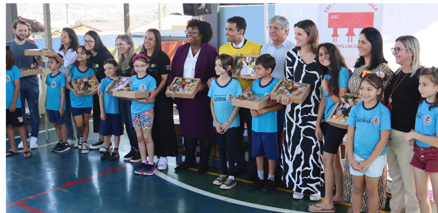
Entrega de computadores para Escolas (EM Nara Manella)